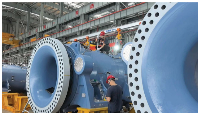
图为湖南运达风电有限公司整机装备制造基地的工人正在进行日常工作。