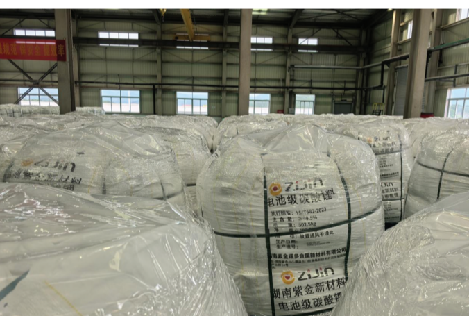
图为紫金锂多厂房内排列的电池级碳酸锂。