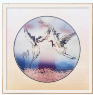
图为本次竞赛一等奖作品《对舞》。

本报讯(记者 李福琳 口 卓布吉)6月1日,2026中国工艺美术博览会在福建福州闭幕。泉州城市镇集体工业联合社获“突出贡献单位”;在首次举办的全国轻工工艺美术品设计技能竞赛中,泉州展团斩获14个一等奖、20个二等奖、20个三等奖,总计54个奖项。其中,一等奖数量与优胜作品总数均位列全国所有参赛地市第一,以占全国12%的一等奖数量及11%的优胜作品总数,在全国所有参赛地市中强势领跑。全国轻工工艺美术品设计技能竞赛参考成品设计与制作(占80%)、现场绘图设计(占20%)两部分综合评分,成品设计与制作还引入观众网上投票(占比5%)。竞赛从“赛作品”极大激发了工美人的创新潜能。泉州展团共有179人携260件作品报名参赛,这份蓬勃的力量最终转化为沉甸甸的奖牌。