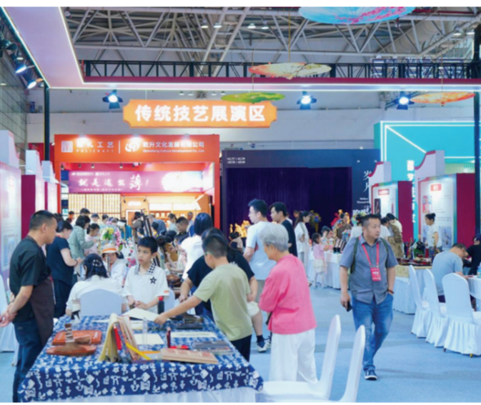
图为2026中国工艺美术博览会福建展区。

在数字科技创新方面,福建积极推动传统工艺与现代科技深度融合,落地全省首个AI设计藤铁工艺产品服务云平台,大力推广3D打印技术在脱胎漆器、德化白瓷、惠安石雕等传统工艺领域的规模化应用。在文旅融合发展方面,福建深入开展“工美进景区、进景区、进古宅”行动,依托古城古镇、历史文化街