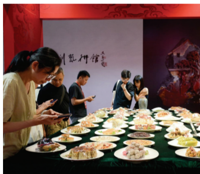
图为2026中国工艺美术博览会展会观众观赏用寿山石制作的满汉全席。

持续的政策赋能,推动福建工艺美术形成了体量庞大、体系完备的产业格局。目前,福建省工艺美术产业涵盖11大类、100多个品种,集聚61名国家级、826名省级工艺美术大师及1307名省级工艺美术名人,百万从业人员扎根行业深耕细作,整体产业规模稳居全国前列。区域特色集群的优势同样日益凸显,福州经过多年发展,已形成“中国寿山石文化之都”“中国脱胎漆艺之都”、