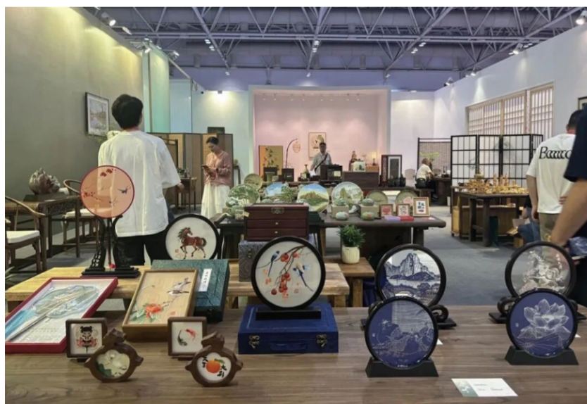
图为2026中国工艺美术博览会温州展区展销区域。