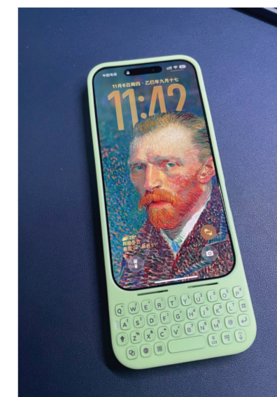
图为有可以打字的键盘手机壳。