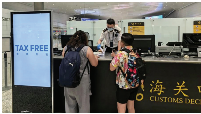
图为广州海关所属广州白云机场海关关员正在为出境旅客办理离境退税核验业务。

7月1日,作为离境退税2.0版政策的关键举措,“全流程无纸化”“小额抽检制”等正式落地。优化措施实施后,不少境外旅客体验到了政策升级带来的丝滑退税新便利。