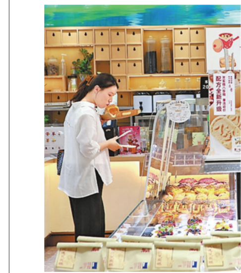
图为消费者在郑州仲景生活康养路店选购药食同源面包与茶饮。

西安交通大学知识产权研究中心主任马治国指出,中医药非遗想要在健康赛道行稳致远,不能局限于文创单品短期走红,还要补齐知识产权保护、质量标准两大短板,推动建立道地药材溯源体系、古法工艺量化规范,引导行业从网红单品营销向长效规范化产业发展升级。