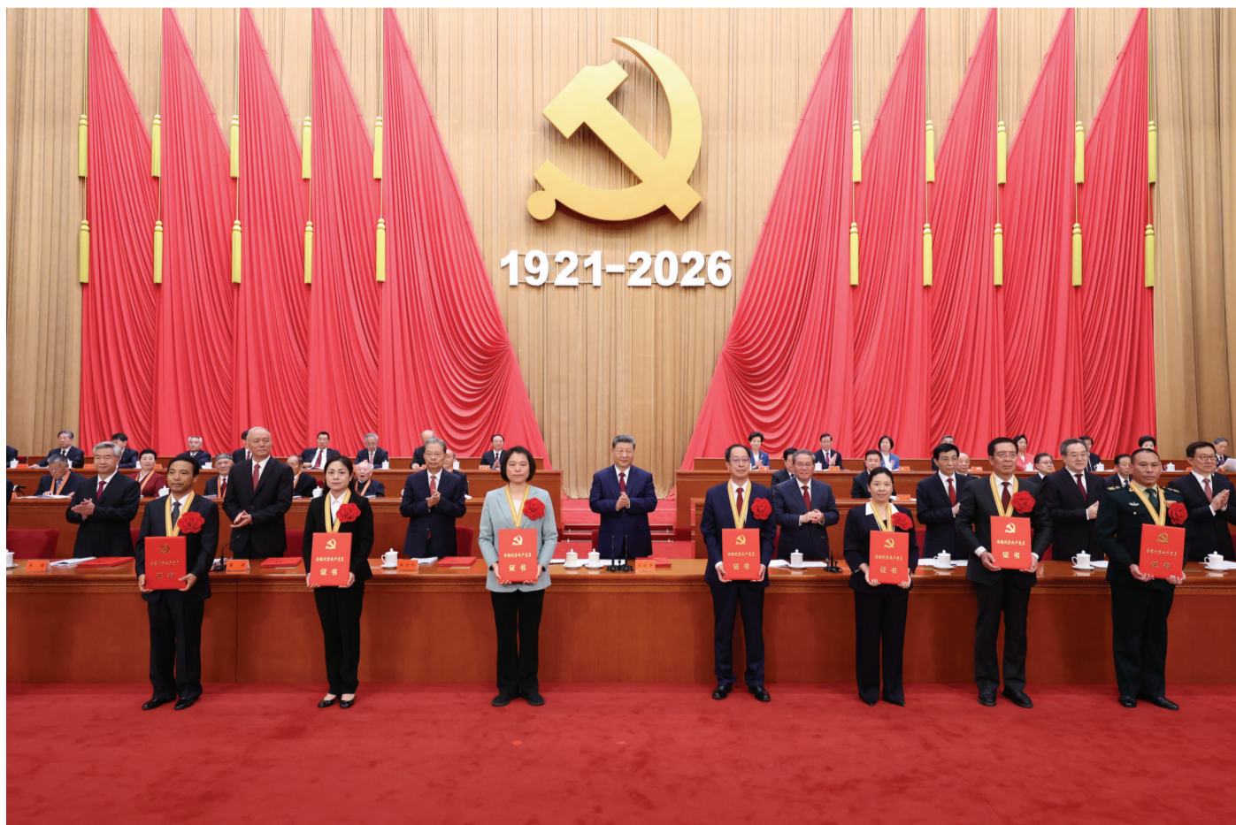
7月1日上午,庆祝中国共产党成立105周年大会在北京人民大会堂隆重举行。这是习近平等党和国家领导人为受表彰的全国“两优一先”代表颁奖。