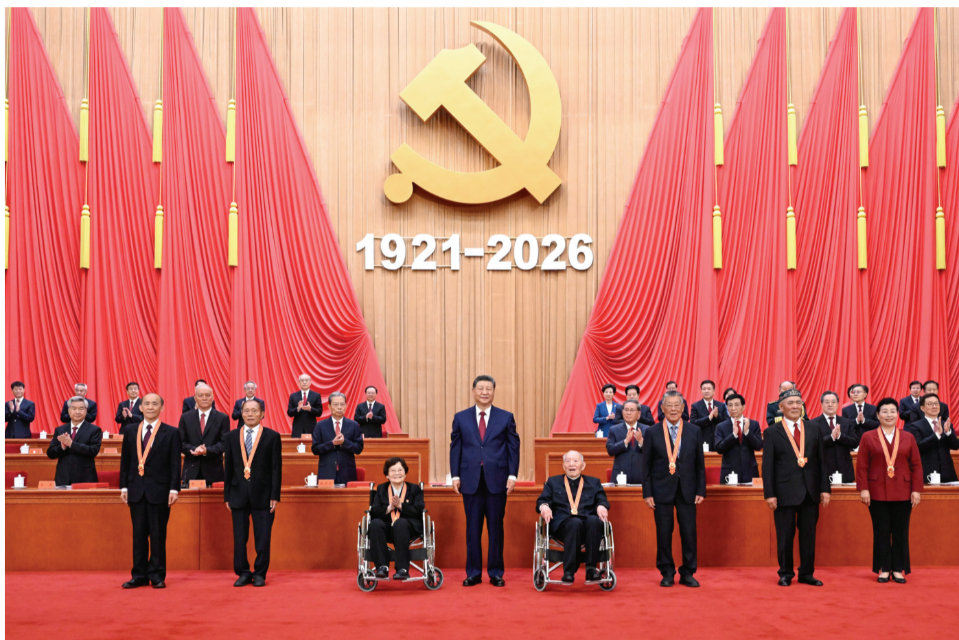
7月1日上午,庆祝中国共产党成立105周年大会在北京人民大会堂隆重举行。中共中央总书记、国家主席、中央军委主席习近平发表重要讲话。