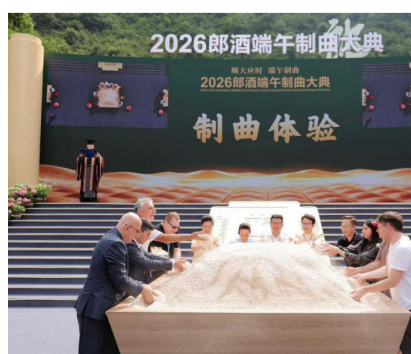
图为全球酒庄代表沉浸式体验制曲。

随即,他又以流利的英文将这份源自赤水河左岸的酿造信仰与时间价值,清晰而有力地传递给在场的每一位国际友人,赢得中外嘉宾的热烈掌声与深深共鸣。 今年的端午制曲大典,郎酒首次邀请外宾沉浸式体验,让世界零距离体验“曲为酒之骨”的奥秘。仪式上,传承与创新交织,经典与时尚相融,民族与世界共鸣——郎酒庄园正向世界讲述中国白