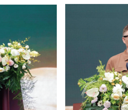
图为茅盾文学奖获得者、中国作家协会副主席麦家致辞。

学便不再是抽象概念,而成为可感知、可敬畏的活态文明。 中外名家共鸣:酒是一种世界语言 麦子,是制曲的起点,也是这场大典真正的主角。现场,河南省小麦产业技术体系首席专家、河南农科院研究员雷振生分享了庄园酱酒制曲专用小麦“郎曲麦9号”阶段性科研成果,展现了世界酒庄的创新实力与进取姿态。 茅盾文学奖获得者、中国作家协会副主席麦家,则从一个独特的角度分享了他与郎酒庄园的相遇:“今天站在制曲大典的现场,我觉得自己‘来到了地方’——因为今天的主角是麦子,而我叫麦家,我们是同一‘门’、我们是同一‘家’。” 麦家还从文学与酒的深层关联出发,分享了他对酒的哲思。他说:“人类是万物之灵,却也因此难以避免孤独,我们一生中当虽然有欢快的时候,但总是有排遣不了的孤独,这是人之为人的一部分。而小说诞生于孤独的个人,酒又何尝不是?美酒既能助兴,也能浇愁。文学、艺术、美酒,都是我们在孤独时刻的‘拐杖’。” 这份来自文化与酒的感受,也引发