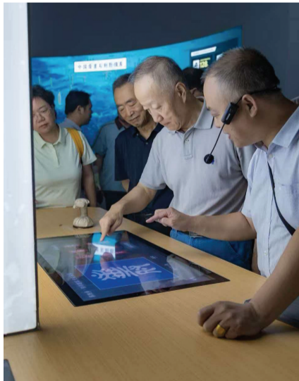
图为游客正在进行电子拓印体验。