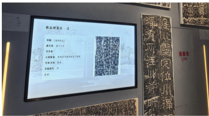
图为祁阳浯溪石刻数字博物馆内数字展示区。

自5月29日开始，记者跟随“全国经济媒体永州调研行”团队走进永州各大产业阵地，实地走访展馆园区、生产车间、田间地头，近距离观察永州深耕实体经济、做强产业链条的生动实践。