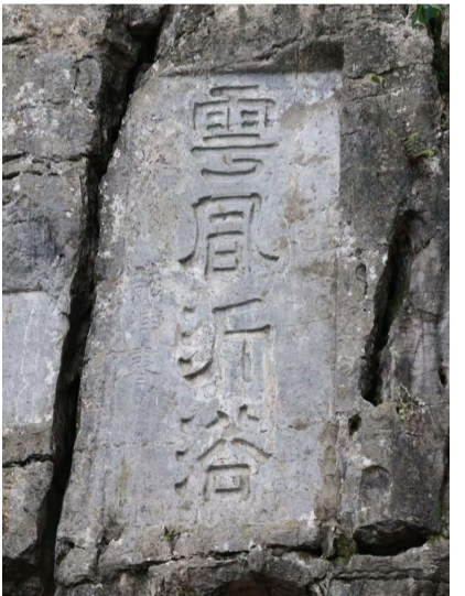
图为浯溪碑林内摩崖石刻。