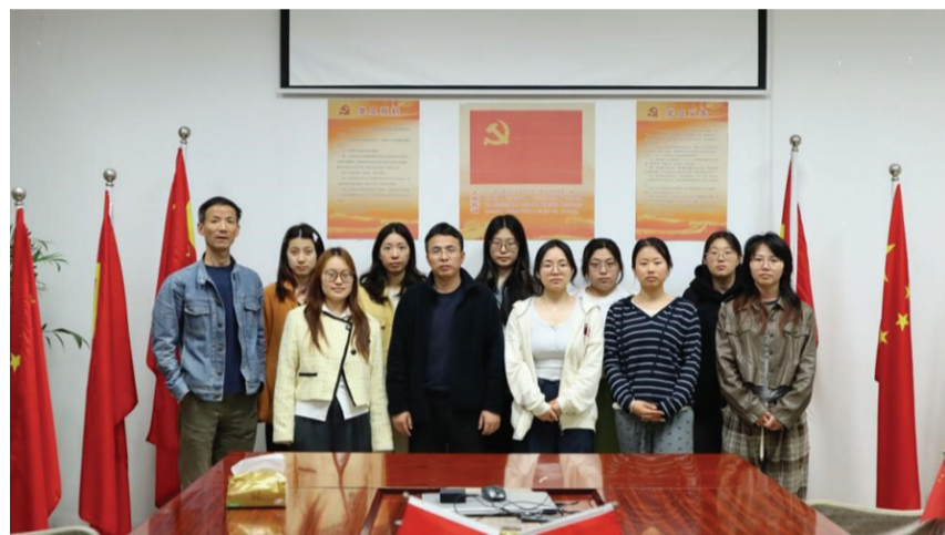
图为宋锦研发小组成员。