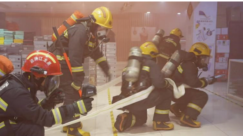
图为克山县消防大队进行消防演练。

从繁华的城市商圈到静谧的乡村院落,从细致的隐患排查到逼真的实战演练,从严格的责任落实到广泛深入的宣传引导,克山县上下正以“时时放心不下”的责任感和积极担当作为的精气神,扎实推进应急管理和消防安全的各项工作。在这里,安全不再是悬挂在墙上的标语或停留在文件中的口号,而是商场里随手可及的灭火器、楼道里清晰明亮的应急指示灯、社区里循环播放的安全提示广播,是巡查人员专注的目光、是演练场上矫健的身影,是预警信息及时送达的安心。这份看得见、听得着、感受得到的踏实与祥和,其背后是克山县上下以钉钉子精神,一锤接着一锤敲,持续压实安全责任、创新工作方法、夯实基层基础的不懈努力。这份努力,不仅为全县人民欢度新春佳节营造了安全稳定的环境,也为克山县奋进高质量发展新征程奠定了最为稳固的安全基石。