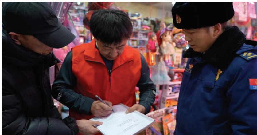
图为克山县应急局等部门在商场进行安全巡查。

这场成功的演练,其背后支撑是克山县近年来持续用力、不断完善、高效运转的“大应急”管理体系和应急处置机