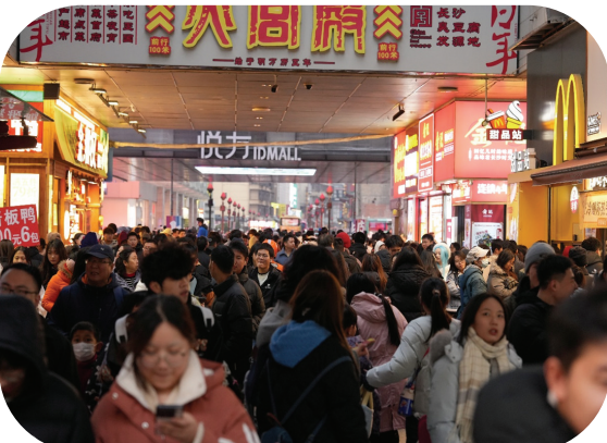
湖南省长沙市坡子街，游客摩肩接踵。

本报讯 （记者 唐瑞 李福琳）跨年夜，首都博物馆内灯火与乐声不绝；元旦清晨，衡山上人流如织；假期中，漳州古城内不少人举着热饮拍照打卡；北京南锣鼓巷、长沙岳麓山下、衡阳南岳大庙……游客在古色古香的街巷中留影，城市的烟火气与节日的仪式感交织在一起，折射出元旦假期文旅消费的火热景象。