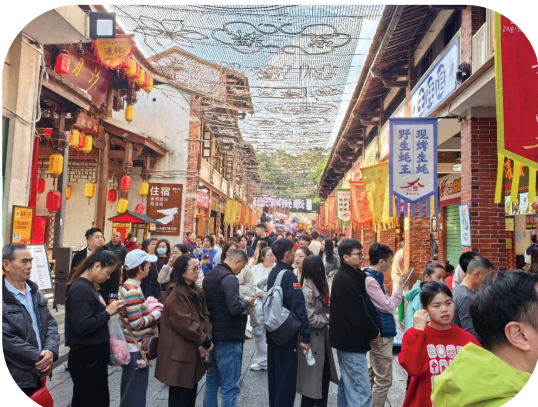
福建漳州古城内游人如织。李福琳 摄