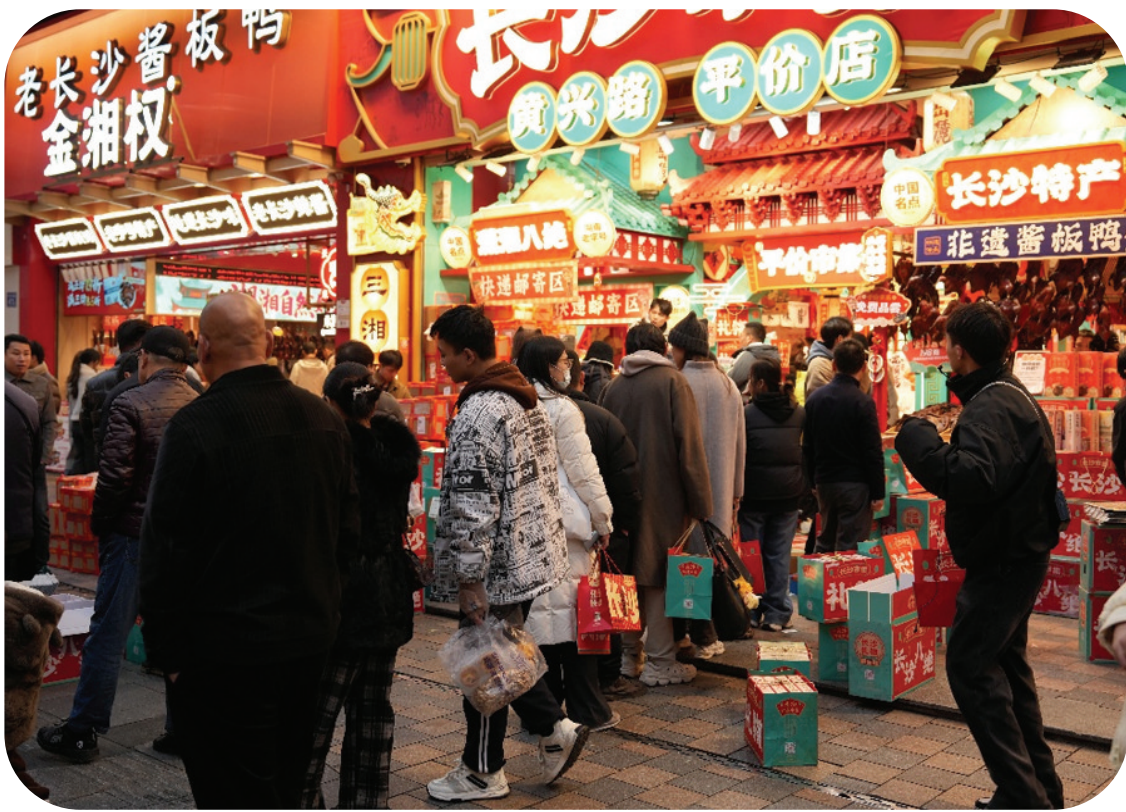
湖南省长沙市黄兴路，游客正在排队购买当地特产。