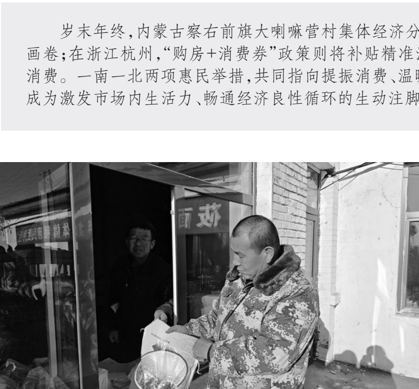
图为村民领取福利。

产品创新不断结出硕果。目前，新雅酒庄已形成藏系、钻系、选系、甜酒、白兰地烈酒五大系列50多个品种的产品矩阵。与此同时，通过在西安设立全国运营中心，发力电商渠道，产品已销往陕西、福建、四川、湖北等多个省份。