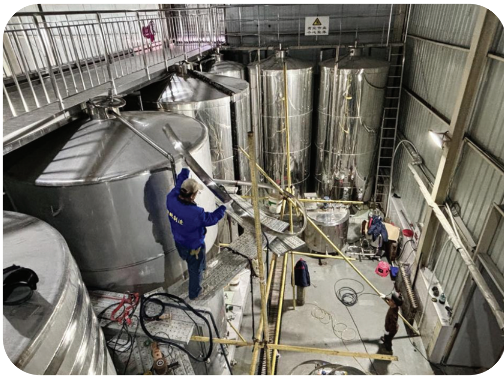
图 为工人正在为发酵罐加装冷带。