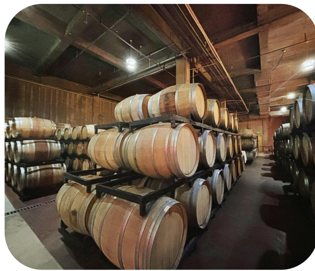
图 为新雅酒庄的地下酒窖中,葡萄酒正在橡木桶中陈酿。