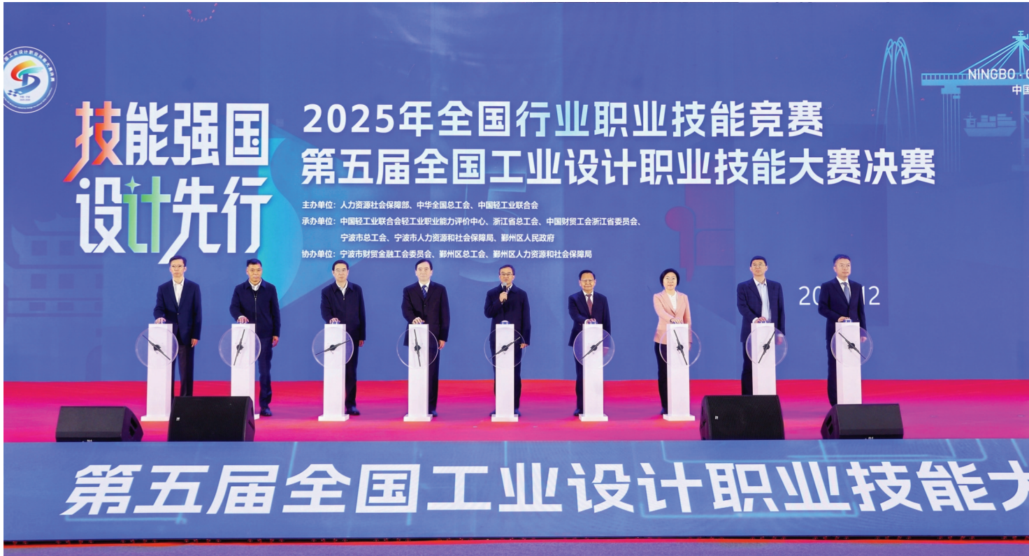
图为2025年全国行业职业技能竞赛第五届全国工业设计职业技能大赛决赛开幕式现场。

张崇和表示,全国工业设计职业技能大赛已经举办到第五届,覆盖家具设计、无损检测等 14个领域。13000多名选手参加预赛,2800多名选手参加决赛。大赛产生“全国技术能手”58 名,“五一劳动奖章”获得者11名,“全国轻工技术能手”308名。大赛成果显著,成为工业设计 领域的权威赛事。第五届工业设计职业技能大赛,既有家具设计师、陶瓷产品设计师传统经典赛 项,也有制图员、人工智能训练师两个数字化新兴赛项。19个省市区举办选拔赛,7个省市区 举办推荐赛,28支代表队的455名选手参加决赛,从349位入选中抽选的近100名专家执裁决 赛。宁波市精心组织,鼎力承办,提供了周到的服务保障,为成功举办奠定了坚实基础。