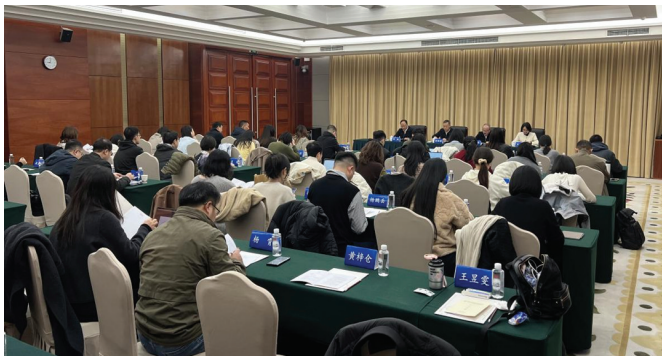
图为中央和全国性行业媒体青年编辑记者增强“四力”教育实践贵州行活动启动现场。

本报讯(记者王薛滔文)为深入学习贯彻党的二十届四中全会精神,11月24日,由中国记协、贵州省委宣传部、贵州省记协共同举办的中央和全国性行业媒体青年编辑记者增强“四力”教育