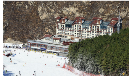
图为雪友在万龙滑雪场享受滑雪乐趣。

崇礼作为国家级滑雪旅游度假地,历经20余年发展,全区已建成包括云顶、万龙、太舞、富龙、银河在内的9家国际水准滑雪场,雪道总数219条、总长178公里。2024—2025雪季,崇礼接待游客523.5万人次,实现旅游总花费60.7亿元,成功推动“冷资源”转化为“热经济”。2025年夏季旅游同样表现亮眼,接待游客510.4万人次,旅游总收入