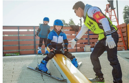
图为教练正在指导小朋友体验旱地滑雪。

目前,场地已经建成了7个不同高度的旱雪气垫跳台。除了面向大众爱好者的1—8米的跳台之外,10米和14米两个对标冬奥会比赛项目的大跳台主要供专业队训练使用,包括国家队,以及河北、黑龙江等省级集训队,都将这里作为夏季的主要集训地。