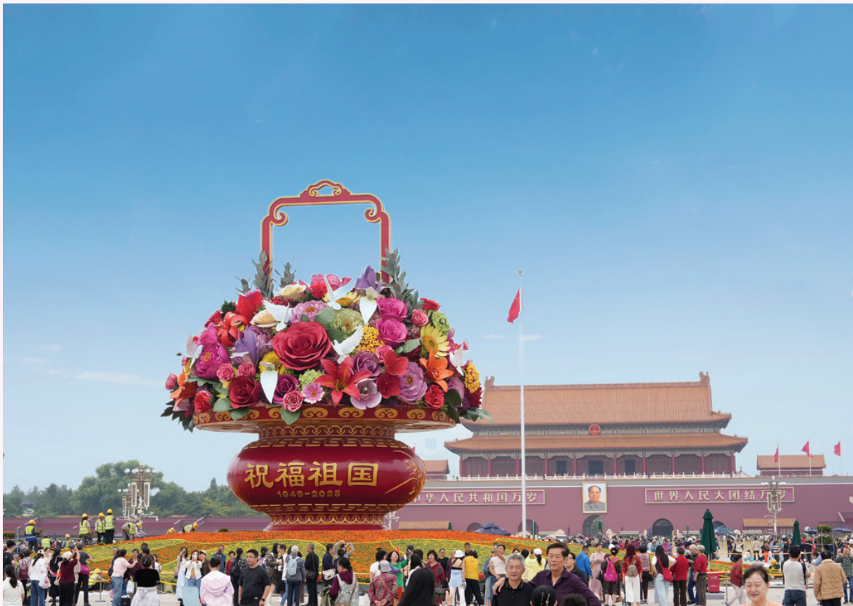
图为天安门广场的“祝福祖国”花篮。

本报讯 (记者 赵 曦 □ 唐瑞)国庆节临近,“祝福祖国”花篮亮相天安门广场,各地游客纷纷与之合影或拍照留念。记者在现场看到,“祝福祖国”花坛以喜庆的花篮为主景,花坛底部直径45米,为向日葵图案,寓意葵花朵朵向阳;篮体有“祝福祖国,1949—2025”和“欢度国庆,1949—2025”字样。