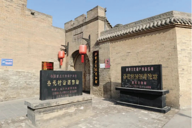
图为杏花村汾酒老作坊旧址。