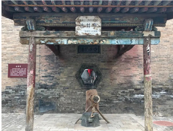
图为杏花村汾酒老作坊旧址一隅。