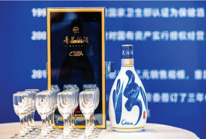
图为青花汾酒产品。

这片占地九千平方米的建筑群，包含了从泉泉益、义泉泳到晋汾酒公司时期的酿造厂旧址，至今仍然在产酒。 “它是全国保存最完好、历史最悠久、规模最大、组成要素最全的白酒老作坊。”每当有访客，讲解员都在这里讲述着老作坊的成就。 尤其是它独特的“前店后坊”格局，完整保留了从酿造、储藏到销售的流程，是一个活生生的酿酒历史博物馆。 作坊里，那些跨越了漫长岁月的遗迹随处可见。