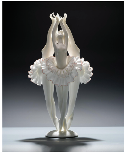
图为中国工艺美术大师柯宏荣作品《天鹅湖》。