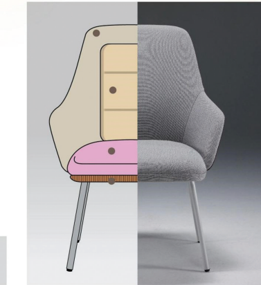
分四区填充的巧思 让每一寸压力都找到妥帖的归处 倚坐其上恰似被「轻柔的棉团」温柔环绕 沉浸式的舒适体验 如暖阳般倾洒而来

森林的呼吸藏在树木的年轮里,自然原木在晨露与暮光中生长,天然木纹是时光镌刻的抒情曲。 简森II原木风沙发将北欧森林的静谧封印于每一道肌理,天然木纹深浅交错,流淌着自然的韵律。榉卯工艺重现匠心温度,带来温润坚实的坐感体验。 不同的设计语言书写同一份对自然的礼赞,沙发亦是“时光的容器”,收纳绽放的生机、童年的折纸、森林的私语,圣奥让办公空间成为自然美学的延伸。