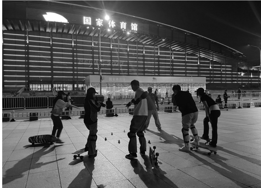
图为近日在国家体育馆前广场,陆冲爱好者正在交流技巧。

业内人士指出,面对陆冲市场加速细分趋势,如何满足特定运动群体需求或成一众品牌当下要研究的首要课题,在专业性与众大众化需求之间寻找平衡点成为关键。