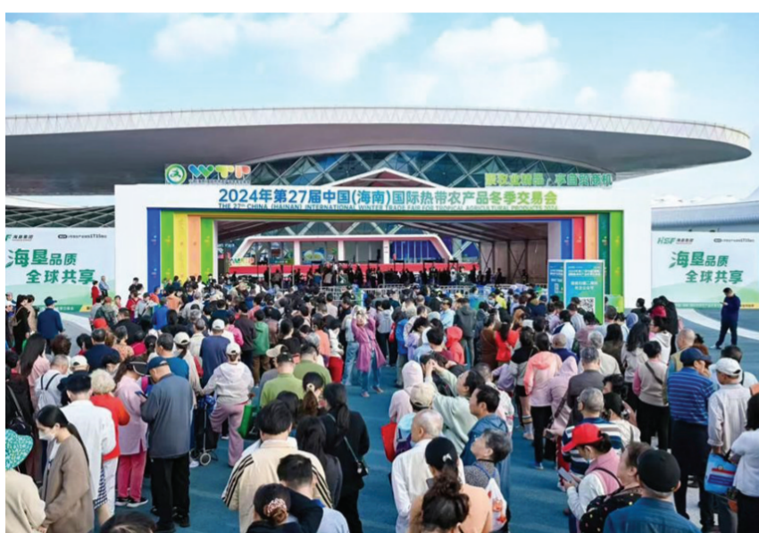
图为第27届海南冬交会现场。

本报讯(记者 郑红梅)日前,2024年第27届中国(海南)国际热带农产品冬季交易会(以下简称“冬交会”)在海南国际会展中心闭幕。记者从组委会获悉,本届展会现场客流量17万人次,现场交易额3822万元,现场订单交易总额45.8亿元,项目签约11个,签约金额9.8亿元。 为期4天的展会上,瓜果飘香、好物汇集,各类“新奇特优”的海南热带高效农业精品琳琅满目,热带花卉香气沁人,黄晶果、红菠萝、芒果凤梨、西瓜凤梨色泽诱人,胡椒香玉别具特色。依托海南自贸港加工贸易出口政策优势,海南各类加工农产品受到客商青睐。 冬交会上,大疆农业无人机、捷蜂智蜂系列机器人、海南大学胡椒采摘机器人等智慧农业设备各展身手,全方位呈现热带高效农业高质量发展进程中的信息化应用,让观众看到科技助力乡村振兴的美好未来。