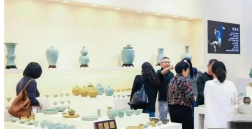
图为观众在参观2024深圳国际茶器美学设计展上展出的茶具。

12月12日,2024中国(深圳)国际秋季茶产业博览会在深圳会展中心(福田)拉开帷幕,同期举办的2024深圳国际茶器美学设计展上,五大茗窑区、非遗名品区、茶空间美学区、精品茶器区、臻选品牌区、港茶茶器区、原创匠产区、匠心草单木集八大核心展区展出景德镇瓷、汝窑、龙泉窑、钧窑、定窑、紫砂、建盏、金属(金