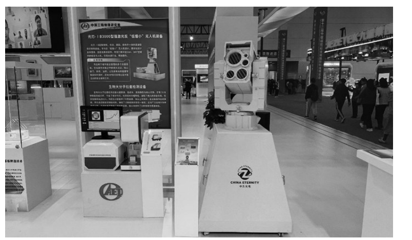
图为“低慢小”无人机装备。