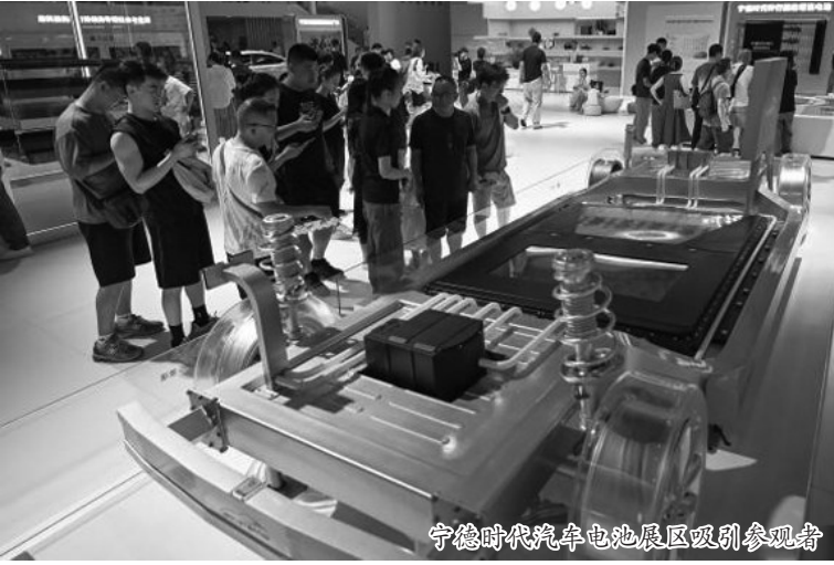
宁德时代汽车电池展区吸引参观者

9月1日,在四川成都举行的第二十七届成都国际汽车展览会人气颇旺,汇集了油、电、混三大类车型,展出车辆超1600台。据悉,此次成都车展还专门为新能源汽车设立了“专馆”,吸引了18个新能源汽车品牌参展。 (中新网)