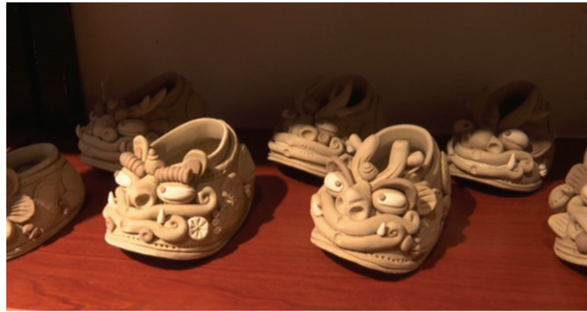
图为陶艺作品瑞兽娃娃鞋。

本报讯(记者 丁新伟 口 郭晶)今年以来,山东省枣庄市山亭区财政局先后通过增强财政保障能力、加强资源统筹、优化支出结构,持续加大对“双碳”工作的财政资金投入力度。