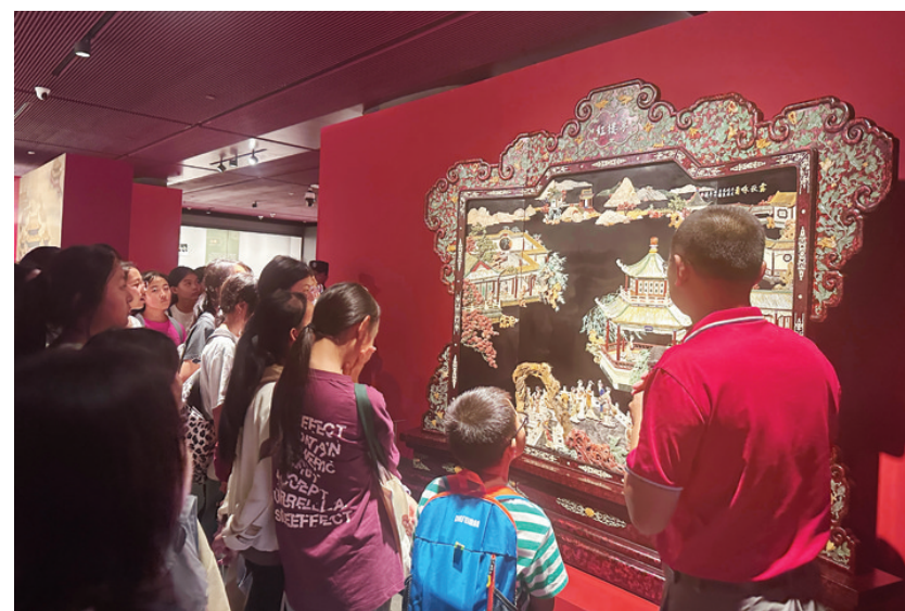
展览成为暑期游学热门打卡地

在雕刻展区，观众可以了解到牙雕、玉雕等作品的雕刻技法。讲解员介绍说：“如今，传统非遗作品已走入了千万百姓家。现代玉雕、牙雕作品更加注重实用性和装饰性结合，其不仅具有艺术价值，还具有实用价值，很多家庭都会买来当作艺术摆件。”一位游客在看到一件现代雕漆茶具时发出惊叹：“这些作品不仅精美，还非常实用，大师的巧思居然将传统与现代完美结合。”