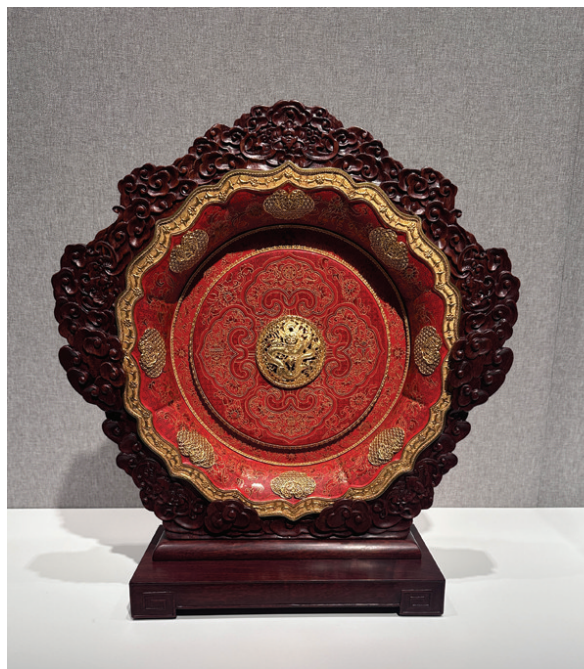
融合金漆镶嵌与花丝镶嵌工艺的《盛世八宝如意赏盘》