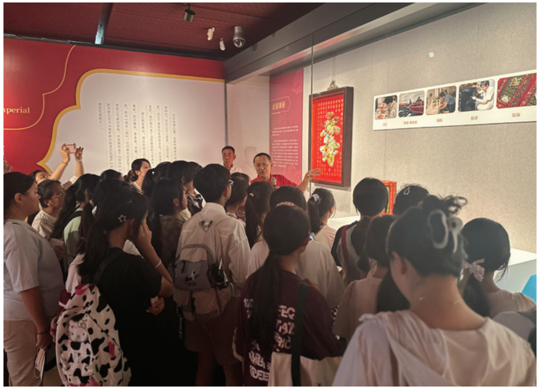
观众全方位了解参展作品的工艺技法与文化内涵

八宝如意赏盘》十分引人注目，金漆和金色纹饰相互辉映，尽显雍容华贵。讲解员向观众介绍：“金漆镶嵌和花丝镶嵌都需要匠人具有极高的技艺水平和审美能力。如今，金漆镶嵌和花丝镶嵌技艺在继承传统工艺的基础上，又融入了现代设计元素，简约的线条和时尚的配色，使其更符合当代审美。”一位