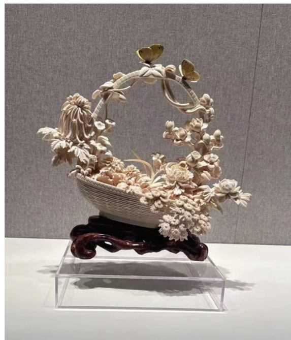
猛犸牙雕《百花争艳》