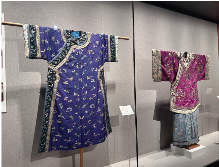
精美的京绣服装作品