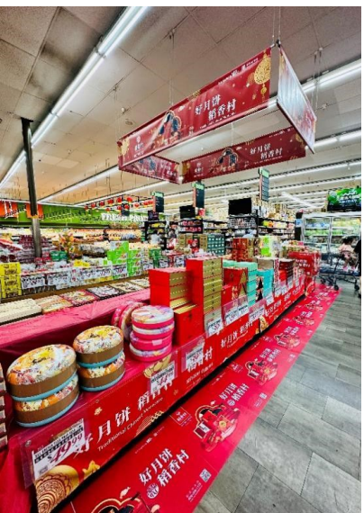
图为稻香村月饼在美国主流超市上架。

在月饼领域,稻香村无论是产品品质的卓越性、供应链的高效运作,还是营销策略的创新力,均稳居行业前沿,堪称名副其实的“多边形战士”。面对市场机遇和竞争,稻香村积极调整自身策略和方向,快速反应抢占市场先机,在持续引领月饼行业创新与发展的同时,实现了从规模扩张到品质飞跃的转身,迈上了质效并进的新征程。(桂源)