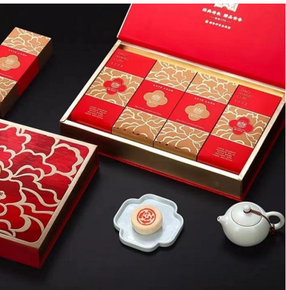
图为牡丹鲜花·荣礼月饼礼盒。