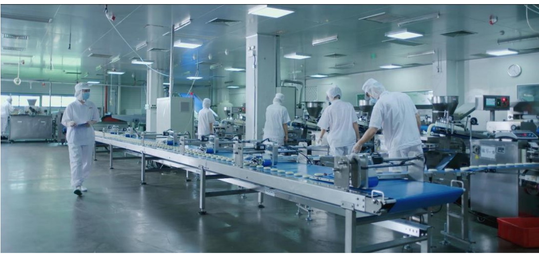
图为稻香村现代化生产线。

近年来,月饼行业经历了由快速增长到深度调整的剧烈阵痛,行业洗牌导致市场份额向头部品牌聚拢,作为糕点食品行业龙头企业、中华老字号稻香村(苏州)不断创新和变革,在群雄混战中破局立足,实现10年卖出超15亿块月饼的佳绩,取得了亮眼的市场表现。