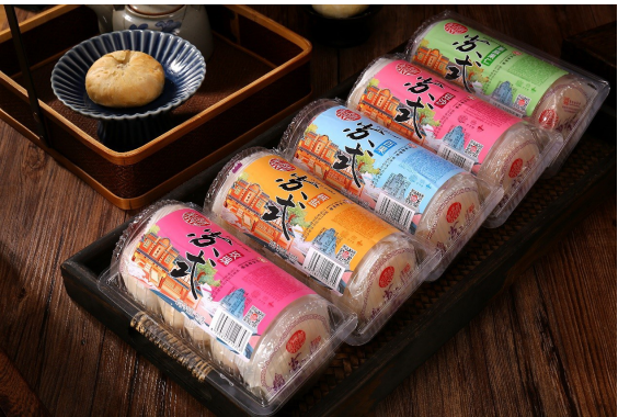
图为稻香村苏式卷月。