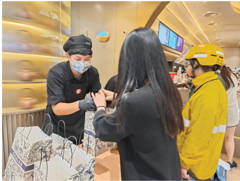
图为消费者和外卖员正在取餐。