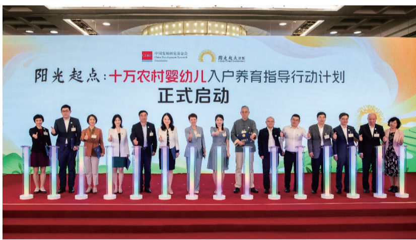
图为“阳光起点:十万农村婴幼儿入托入园指导行动计划”启动仪式现场。

儿童高质量发展是国家和社会实现可持续发展的基础。5月15日,致力弥合中国农村地区儿童早期发展差距的公益项目“阳光起点:十万农村婴幼儿入托入园指导行动计划”在京启动。项目旨在推动农村儿童健康成长和全面发展,实现以人口高质量发展支撑中国式现代化。