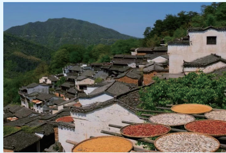
本报记者 卢岳 □ 王紫茜

“未来,随着消费者对精神文化追求不断提升,旅游文创产品市场将持续扩大。文创产品将更加个性化、多样化和品质化,也将更加注重与消费者的互动和体验。”北京社科院研究员王鹏在接受本报记者采访时谈到,为进一步提升旅游文创产品的文化内涵,实现高质量发展,应组建专业的文化研究团队,深入挖掘传统文化元素,为文创产品提供丰富的文化素材;定期对设计师进行文化知识和设计技能的培训,提高其专业素养和创新能力;建立完善的供应链管理,确保文创产品的原材料采购、生产加工、物流配送等环节的顺畅和高效;根据市场反馈和消费者需求,不断对产品进行创新和迭代,保持旅游文创产品的竞争力和吸引力。