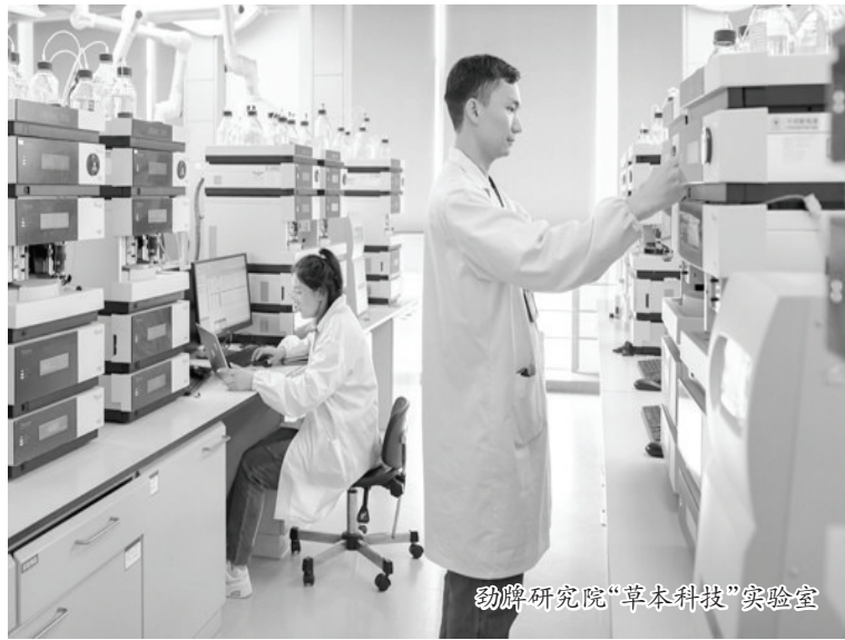
劲牌研究院“草本科技”实验室

尖产品,因其“固本培元,平衡有道”的特点受到追捧;上市10年的毛铺草本茶酒因其“代谢快、负担小”正在成为劲牌另一个全国性大单品;上市不足两年的毛铺草本茶酒因“真”年份和“真”体验深受消费者青睐;2023年5月份发布上市的劲牌清香年代也蓄势待发……劲牌的酒好在哪里?熟悉劲牌的人知道,这一切都得益于劲牌所追求的匠心品质。