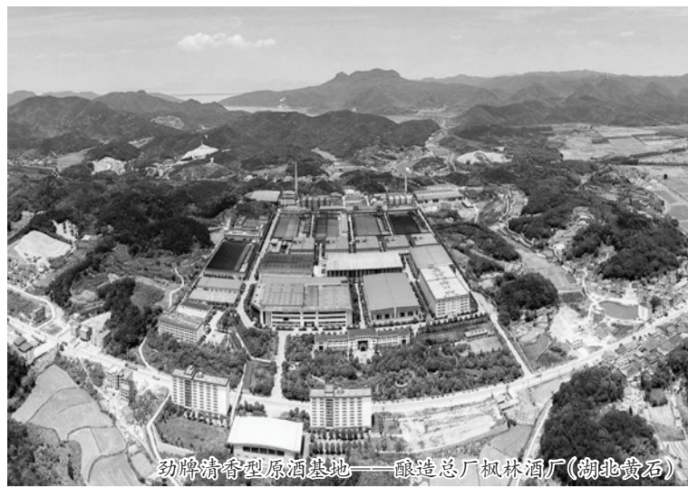
劲牌清香型原酒基地——酿造总厂枫林酒厂(湖北黄石)

雄关漫道真如铁,而今迈步从头越。站在建厂70年的新起点,劲牌初心如磐,笃行不怠,将以“健康人类,永无止境”为企业宗旨,稳步迈向百年新征程。