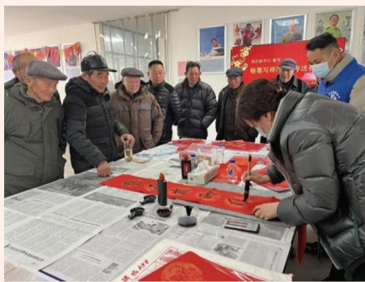
图为“翰墨写祥瑞,迎春送祝福”活动现场。