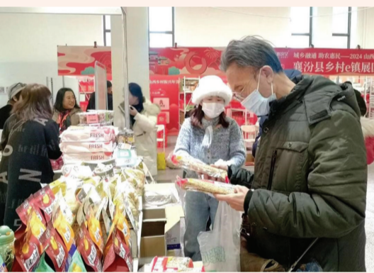
图为消费者正在选购带有“龙元素”的饰品。

顾客们认真挑选心仪的商品,喜爱之情溢于言表。“龙年马上就要来了,今天我们特意来这