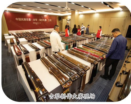
古琴制作大师现场