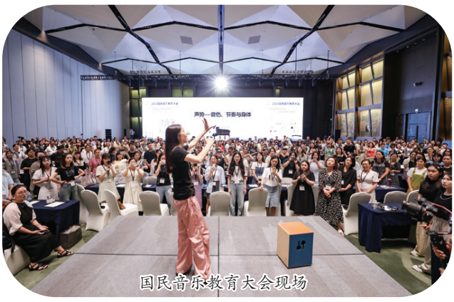
国民音乐教育大会现场