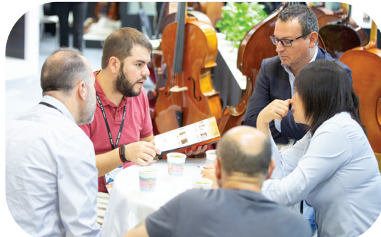
国内外行业人士交流乐器产品