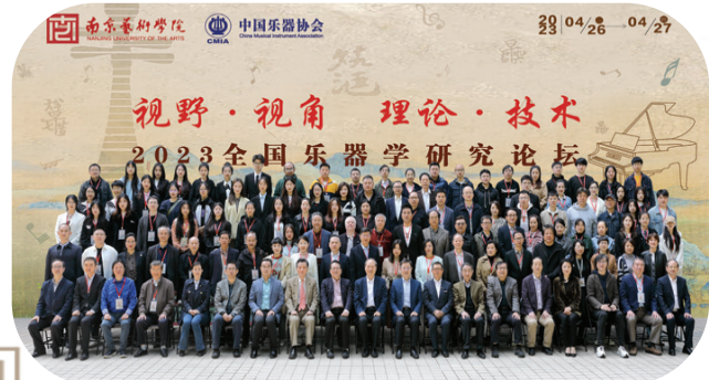
全国乐器学论坛合影留恋