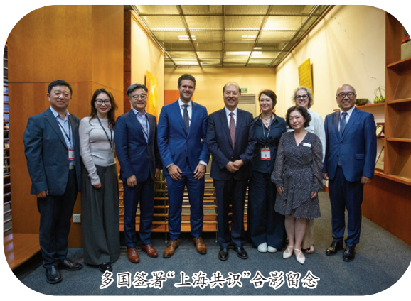
多国签署“上海共识”合影留念