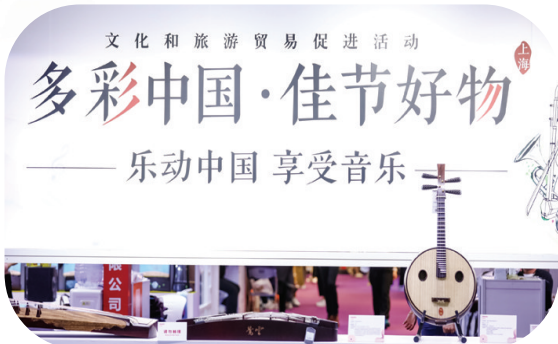
“多彩中国·佳节好物”活动现场