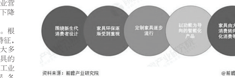
图表示中国家具制造行业产品发展趋势。图例显示围绕新生代消费设计、家具环保逐渐受到重视、定制家具逐步流行、以功能为导向的智能化产品、家具由大众化消费转向个性化消费等趋势。

家企业提供的家具产品功能大致相同。目前,中国家具出口额逐渐提升,而进口额逐渐下降,这反映中国家具的国产化替代逐步提升,同时开始满足国外需求。整体来看,中国家具行业未来市场有一定发展潜力。 中国家具制造行业产品发展趋势。从未来我国国家具行业消费趋势来看,随着“轻