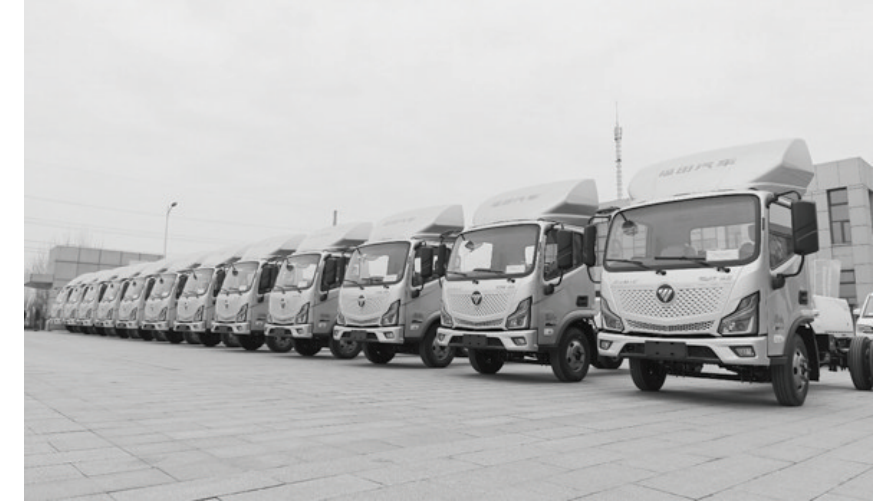
图为福田汽车新能源产品。