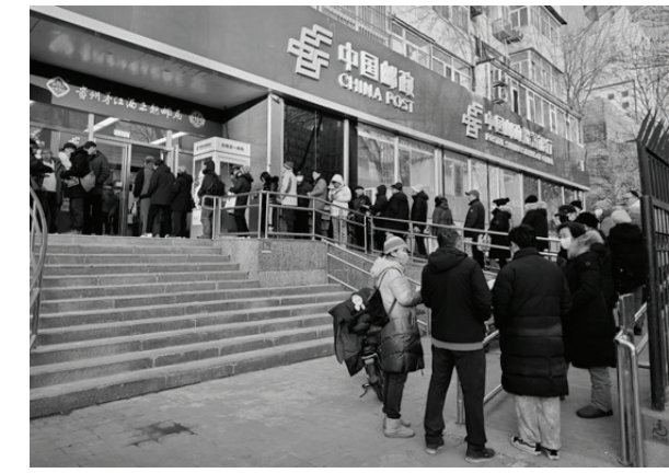
图为龙年生肖邮票深受喜爱,引来消费者排队购买。