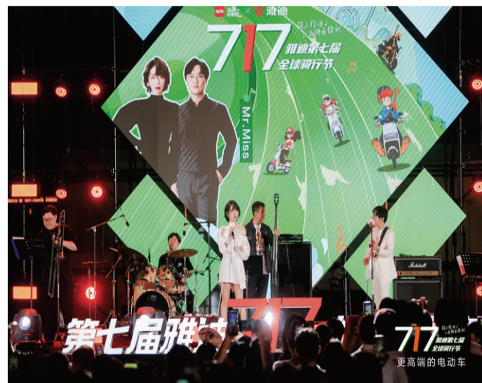
雅迪携手小红书打造盛夏音乐会

纵观全球绿色出行市场，雅迪凭借强大的供应链体系优势，在全球布局7大生产基地，产品出口全球100多个国家和地区，深受超7000万用户的喜爱和青睐，终端门店超40000家，实现