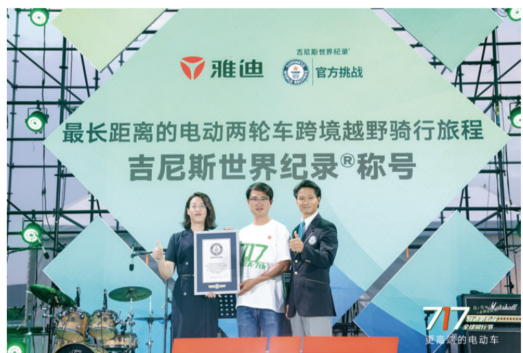
雅迪再获吉尼斯世界纪录官方认证证书