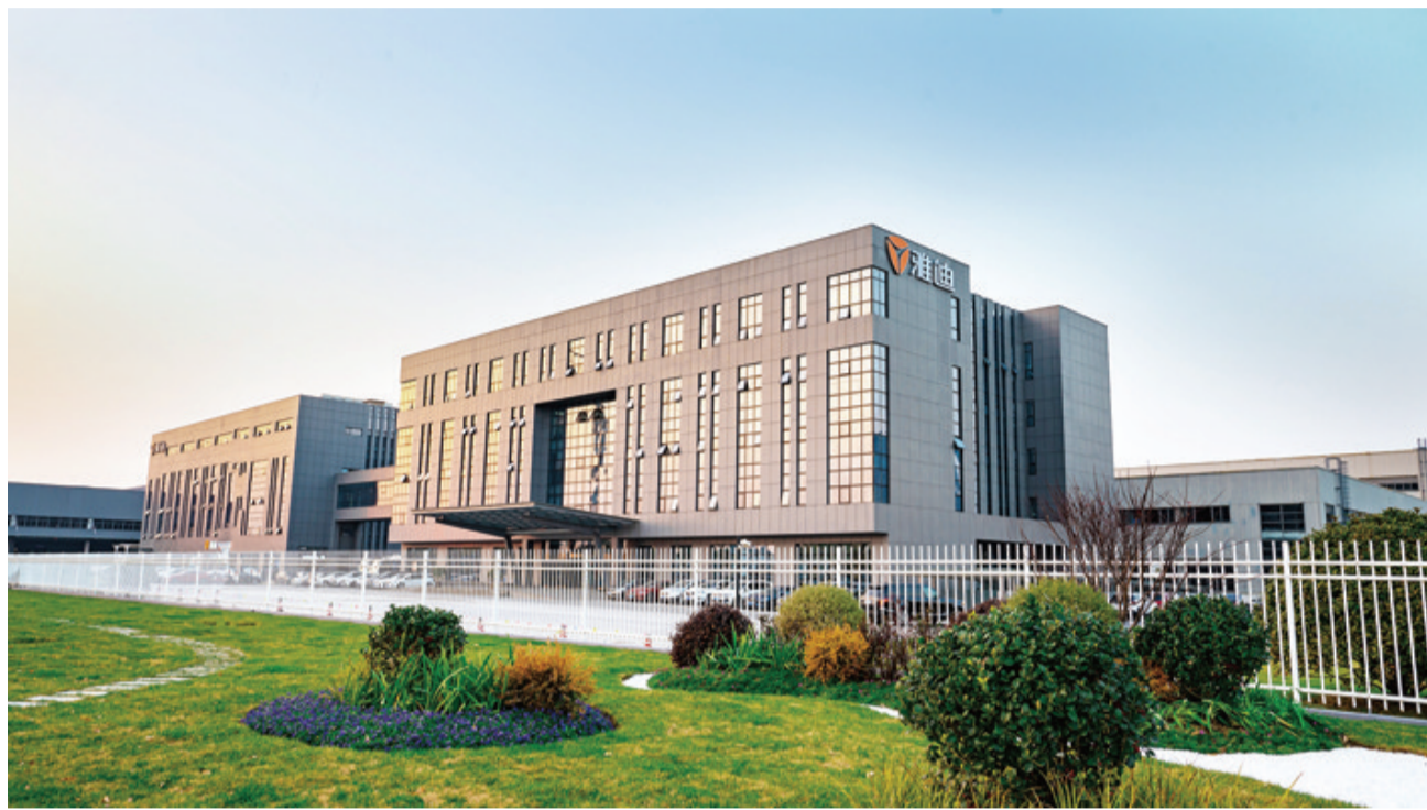
雅迪科技集团无锡总部

实现碳达峰碳中和，是贯彻新发展理念、构建新发展格局、推动高质量发展的内在要求，是党中央统筹国内国际两个大局作出的重大战略决策。放眼全球，一场空前的经济社会变革已然开启，“双碳”航道上百舸争流。随着我国“双碳”战略的实施，绿色发展成为当下产业变革的核心，中国企业也迎来了新一轮发展的机遇。 在此战略背景下，雅迪主动顺应“双碳”发展趋势，率先把握绿色转型机遇，通过倡导绿色出行、深耕绿色科技、推出绿色产品、贯彻绿色理