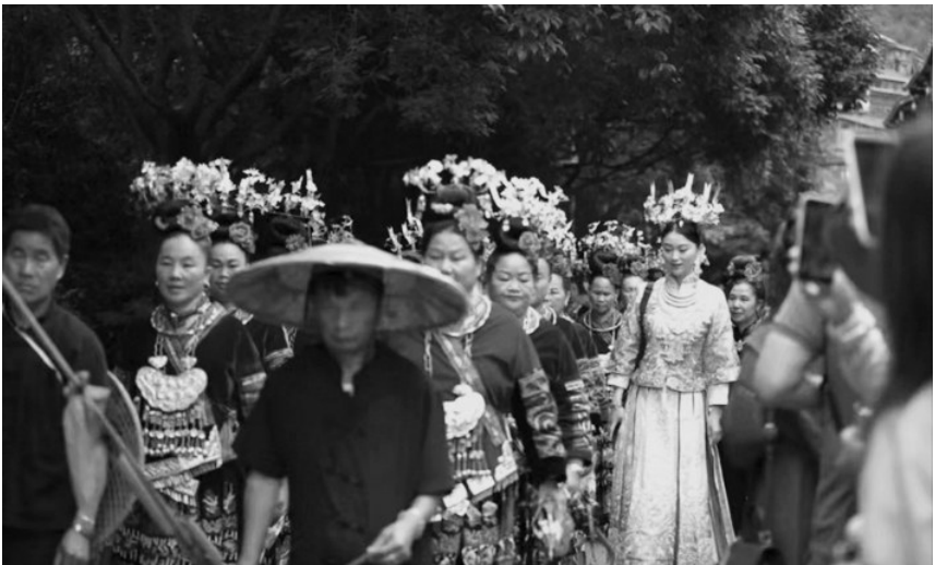
□ 本报记者 卢岳

随着2023年高考结束,毕业旅游高峰如期来临。途牛旅游网截至目前预订数据显示,今年暑期毕业游在高考结束后第一周即6月11日-17日迎来第一波出游热潮,并将从端午假期开始正式进入出游高峰,18-22岁的高考生和大学生成为这个假期的出游“主力军”。