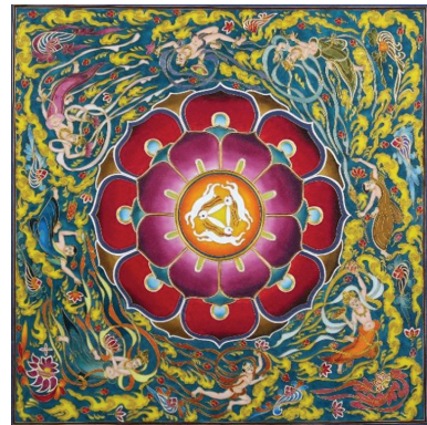
参展作品掐丝珐琅画《敦煌藻井》,右图为“三兔共耳”图案