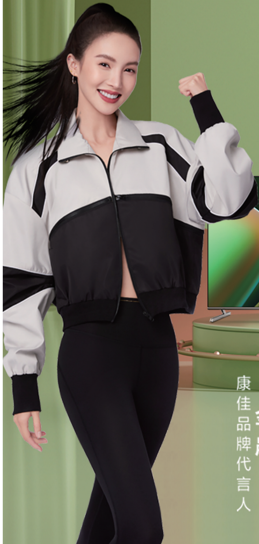
智慧场景屏R6 55" 65" 75"