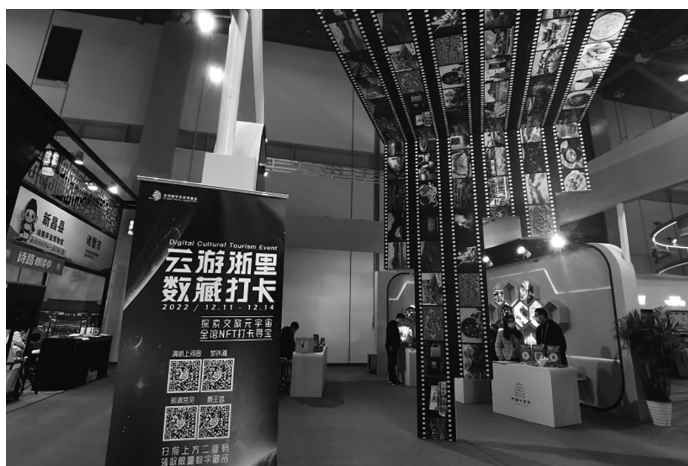
本报记者 叶德宝 马佳丽 牛夏凤 虞倩

水到海岛渔村,古时需行万里路,如今只需轻轻点开“任意门”,浙江人土风情即刻展现在眼前。通过虚拟门,大家便可以去到任意的景区场景,在在线文旅虚拟世界任意游历。在首届数数现场,有一个以“云游浙里·易见未来”为主题的展馆,该馆基于文旅数字内容打造“嵌入式”场景,各种炫酷体验的智能设备齐聚,以沉浸式观展体验为数据会增添“打卡爆款”。同时,还设置了未来文旅主题活动展区,观众可体验“浙里好玩”、感受“浙里文化圈”的魅力、赏味“街头艺人”的活力。“数字化时代,用权行的数据说准确的话,已经越来越成为各行各业交流和社会发展的的重要途径。”杭州市文化广电旅游局杭州市文化和旅游局发展中心主任应晖从数字归集、数据应用、数据应用三方面出发,分享了杭州数字文旅建设实践的经验与成果。2022年1月,杭州率先推出了一体化文旅数据开放共享平台——杭州文化和旅游数据在线。用户可免费查询、分析和下载杭州文化旅游业的数据,包括实时入住率、游客量、银联消费、航空预订、景区实时客流等,为政府数据的