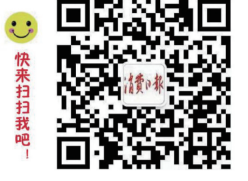
消费日报微信公众平台