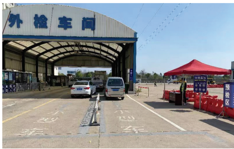
舒心车检落地生根

在优化简政放权方面,“延长环保免检年限”在全省范围全面推行非营运小、微型客车环保免上线检验年限由现行的6年延长至10年。全面推介使用机动车“电子保单”,群众只需提供身份证明、机动车行驶证即可检验车辆。车辆全面推介使用“机动车检验合格标志电子化”,群