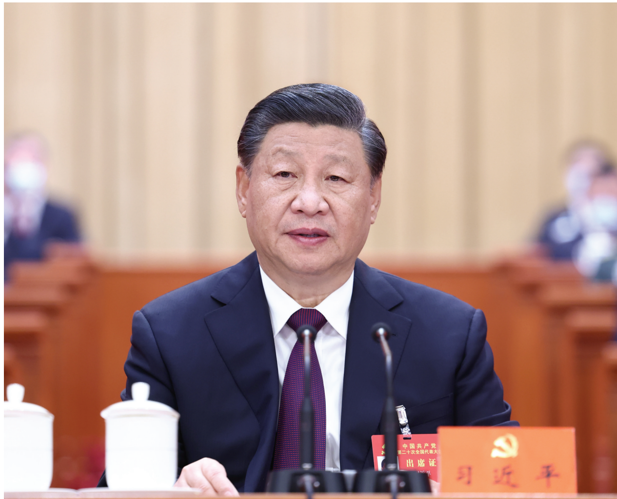
10月22日,中国共产党第二十次全国代表大会在北京人民大会堂胜利闭幕。习近平同志主持大会。

习近平强调,中国共产党走过了百年奋斗历程,又踏上了新的赶考之路。一百年来,党团结带领全国各族人民取得了新民主主义革命、社会主义革命和建设、改革开放和社会主义现代化建设的伟大胜利,开创了中国特色社会主义新时代。百年成就无比辉煌,百年大党风华正茂。我们完全有信心有能力在新时代新征程创造令世人刮目相看的新的更大奇迹。全党要紧密团结在党中央周围,高举中国特色社会主义伟大旗帜,坚定历史自信,增强历史主动,敢于斗争、敢于胜利,埋头苦干、锐意进取,团结带领全国各族人民为实现党的二十大确定的目标任务而奋斗