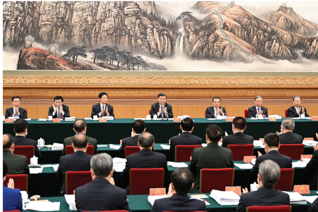
10月18日,中国共产党第二十次全国代表大会主席团在北京人民大会堂举行第二次会议。习近平、李克强、栗战书、汪洋、王沪宁、赵乐际、韩正等出席会议。

新华社北京10月18日电 中国共产党第二十次全国代表大会主席团18日下午在人民大会堂举行第二次会议。习近平同志主持会议。会议通过了关于十九届中央委员会报告的决议(草案)、关于十九届中央纪律检查委员会工作报告的决议(草案)。