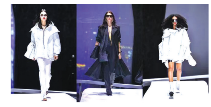
本报记者 丁新伟 □ 杨圣尧

立邦魔术漆不仅是满足新兴消费需求的新潮代产品,更是一个追求标准化交付的解决方案。通过取“质”自然的立邦魔术漆配合立邦“魔术师”的专业服务保障,努力将高品质墙面效果标准化地交付到每一位消费者的家中。立邦“魔术师”团队涵盖了服务流程的关键从业者,大家各司其职与消费者共同领略美好的家居生活,与行业合作伙伴共创美好的发展蓝图,与社会各界共享美好的绿色生活,真正让美好触手可及。”