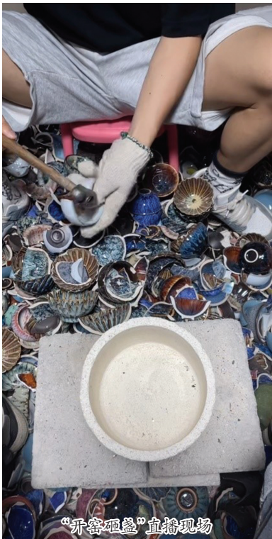
“开窑砸盏”直播现场

在另一个直播间,主播变为陶瓷专家,不断地向消费者“输出”如何鉴赏建盏,介绍建盏的工艺特色及产品特色,以及精品茶盏的评判标准。随后,在开匣钵的过程中,如果遇到和主播描述相符的“珍品”茶盏,便被认定为精品“窑宝”。直播中记者看到,一款闪烁着七彩光泽,并镶嵌“24K”黄金鸟头装饰的茶盏,被主播命名为“七彩孔雀”,并解释其属于“博物馆级”的典藏珍品,市