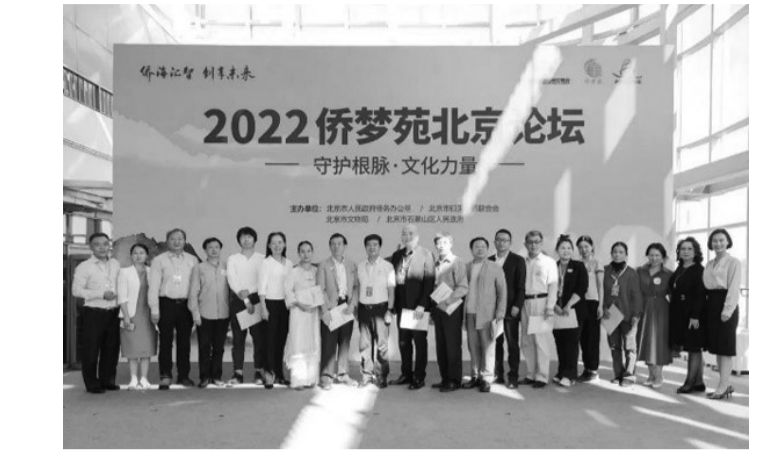
2022 侨梦苑北京论坛 守护根脉·文化力量

坚持精品路线,聚焦咖啡品种精品化、基地生态化、产业集群化、加工精细化,建立保山精品咖啡标准体系,新建、改造一批标准化、自动化、智能化鲜果处理中心及深加工生产线,引进培育精深加工企业入驻保山工业园区咖啡产业园,全面提升初加工咖啡产品的产量和质量,提高精深加工产品品质,推动产业向精品化方向发展,加大保山小粒咖啡区域公共品牌宣传力度,全面提升产业价值链。