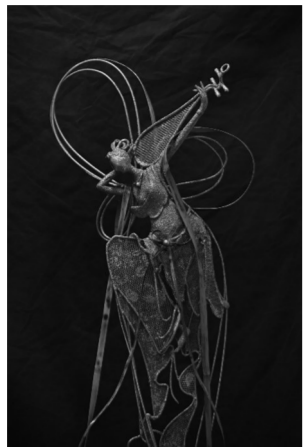
安溪藤编工艺传承人正在制作藤编作品

没想到铁这种坚硬的材质却把敦煌飞天的灵动完美呈现出来。“看!柔软的藤和坚硬的铁,这两种完全不同的材质组合加工成的大公鸡丝毫不没有违和感。”