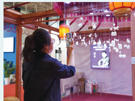
观众在现场观看珠琅、玉石首饰等工艺美术展品。

盛夏未央,秋风待启,与8月的南京天气一样火热的,是8月18日上午在南京国际博览中心开幕的第二届中国工艺美术博览会。46个地方特色展团,32所专业院校,800多家展商,展出面积5万平方米,展示作品涵盖11个大类上千个门类,其中千余名工艺美术大师和大师工匠的精品超过2万件,同期举办论坛、大赛、讲座、绝活演示等12场专题活动。这是工艺美术的顶级盛事,也是行业翘楚的共同期盼。