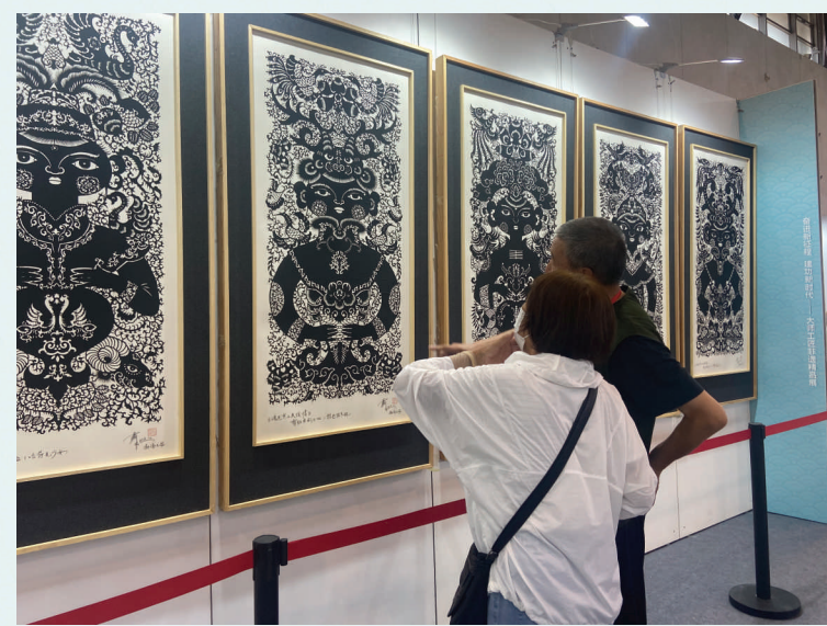
观众在现场参观剪纸、刺绣、玉雕、麦秆画等参展作品。