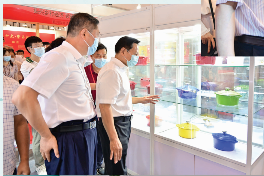
中国轻工业联合会会长张崇和与参会嘉宾逛展。