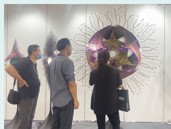
观众在观看“泛雕塑时代艺术展”展区作品。