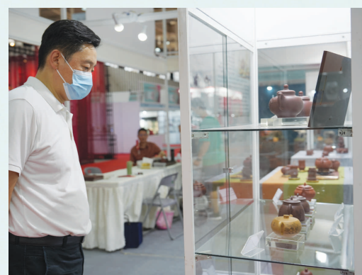
观众在观看紫砂壶、木雕等工艺美术展品。