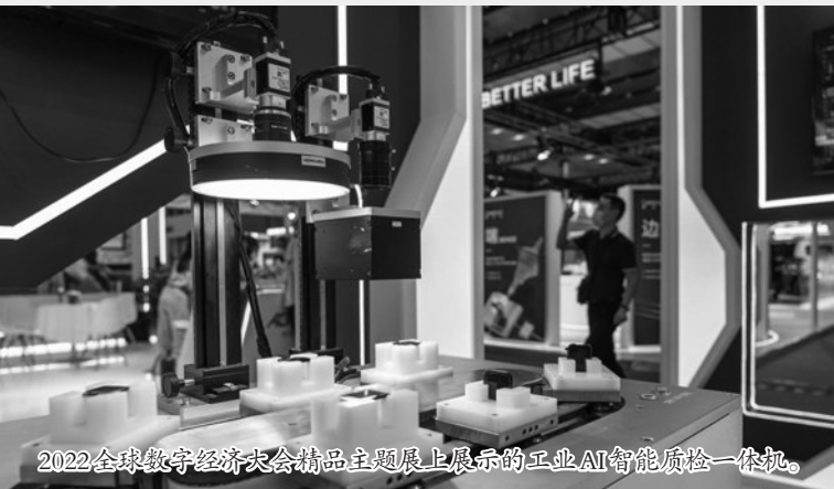
2022全球数字经济大会精品主题展上展示的工业AI智能质检一体机。

7月28日至30日,2022全球数字经济大会在北京国家会议中心举办。大会设置了精品主题展和元宇宙体验馆,展示数字经济发展新成果。