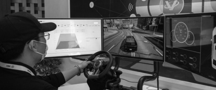
7月28日,在2022全球数字经济大会精品主题展上,一名工作人员进行汽车零件平台漏油缺陷演示。