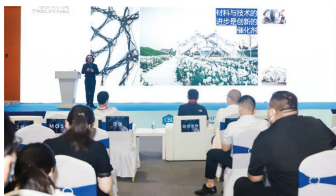
□ 本报记者 陆俊

家居设计的未来发展趋势,不再是单纯、孤立的设计,而是要形成“设计生态圈”和“设计产业链”,形成整合和聚集优势,才能让中国家居设计在世界上占有一席之地。这是日前举行的2022中国建博会“不止·原创”设计馆倡导的行业风向,设计馆在博览会上通过推动设计与产业的深度融合,为家居设计界打开了新的发展方向。