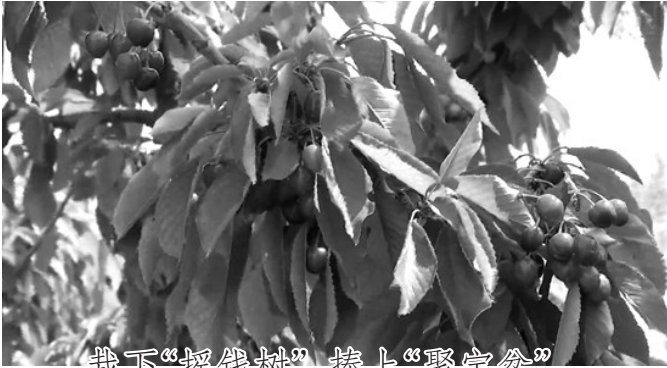
栽下“摇钱树” 捧上“聚宝盆”