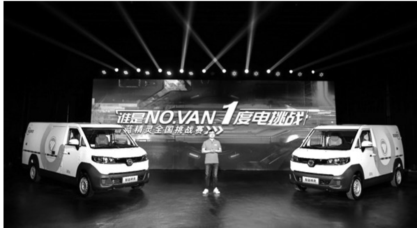
福田汽车启动“1度电挑战,谁是NO.VAN——智蓝精灵全国挑战赛”

如今,各地区城配运输管控不断收紧,政策与油价的双重挤压再加上特殊时期下愈发激烈的竞争环境使得新能源车辆优势愈发明显。六大应用场景定制出击,六大“超”能力加持的“智蓝精灵”不仅为末端配送“最后一公里”带来了能省能赚的运输利器,更是开启了新能源商用车从买到用全生命周期商业化运营的全新时代。今后,福田汽车将进一步以科技赋能产品,助力我国新能源商用车不断转型升级。