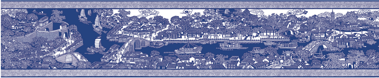
作品《大运河》常州段

多年来他还持续在全国各地寻访民间剪纸老艺人,搜集传统剪纸作品,创建剪刻纸文化艺术资源库,为人才培养提供信息资源。